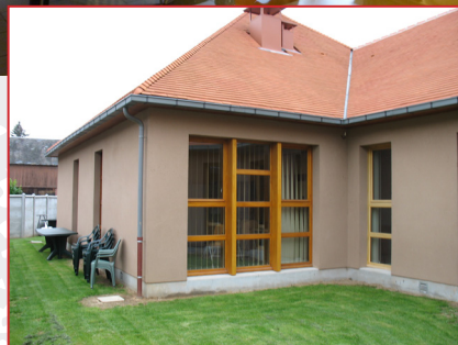
HDJ : Hôpital de Jour