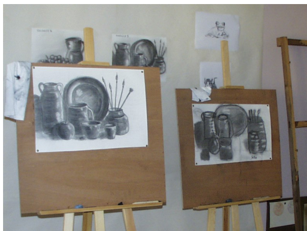
► Salles d'activités

Elle vise en prévenant les rechutes à maintenir ou à favoriser une existence autonome par des actions de soutien ou de thérapies de groupe