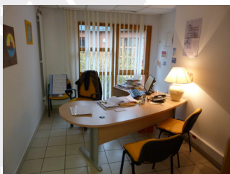
▶ bureau de consultation

CMP : Centre Médico-Psychologique SSR : Soins de Suite et de Réadaptation EHPAD : Etablissement d'Hébergement Pour Personnes Âgées Dépendantes GEM : Groupe d'Entraide Mutuelle ESAT : Établissement et Service d'Aide par le Travail CHRS : Centre d'Hébergement et de Réinsertion Sociale CCAS : Caisse Centrale d'Activités Sociales