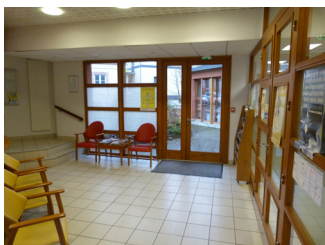
▶ Salle d'attente / Hall d'accueil

Le CMP Adultes de Verneuil est une structure en milieu ouvert participant au service public hospitalier et rattaché au Nouvel Hôpital de Navarre (Évreux).