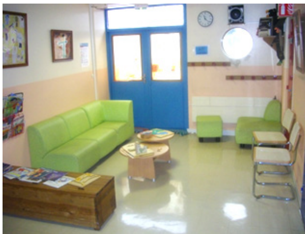
Salle d'attente du CATTPE

Des Rendez-vous avec la famille et /ou les représentants ont lieu à un rythme régulier.