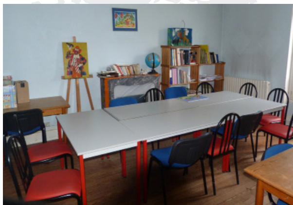
HDJ : Hôpital de Jour

La mission de l'hôpital de jour est d'assurer des soins psychiatriques polyvalents, individualisés, adaptés au rythme et à l'intérêt de l'individu.