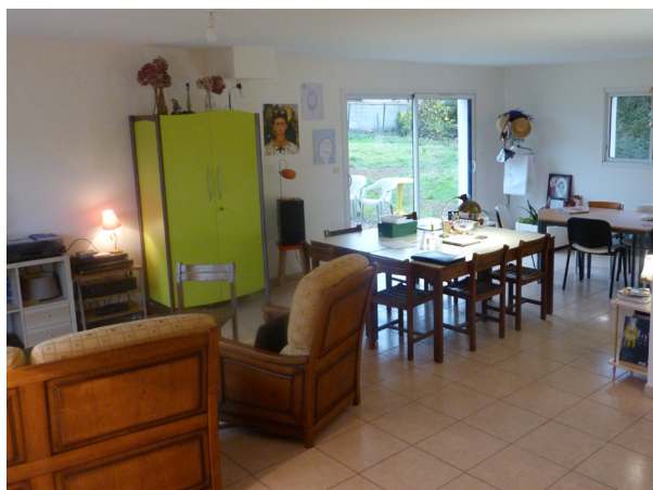
► Salle d'activité

Elle vise en prévenant les rechutes à maintenir ou à favoriser une existence autonome par des actions de soutien ou de thérapies de groupe