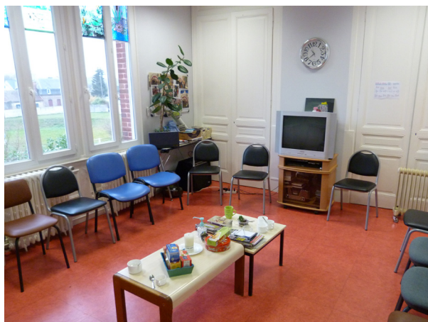
► Une salle d'attente spacieuse

Elle vise en prévenant les rechutes à maintenir ou à favoriser une existence autonome par des actions de soutien ou de thérapies de groupe