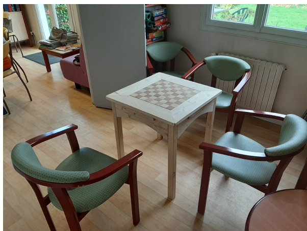
► Salle d'activité

Elle vise en prévenant les rechutes à maintenir ou à favoriser une existence autonome par des actions de soutien ou de thérapies de groupe