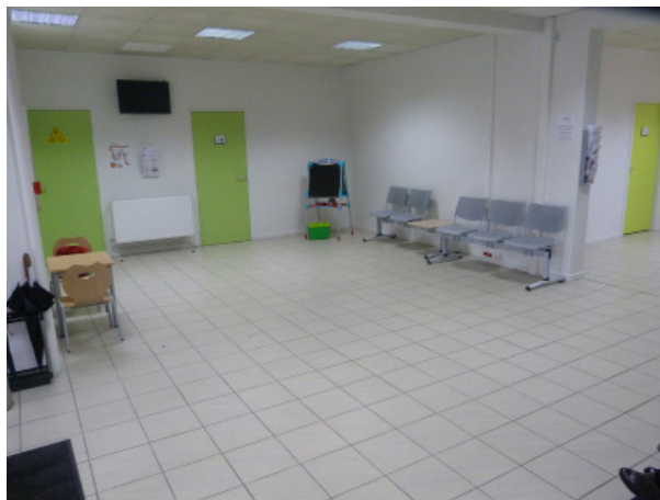
▶ Une salle d'attente spacieuse pour les patients

Le CMP d'Evreux est une structure en milieu ouvert participant au service public hospitalier et rattaché au Nouvel Hôpital de Navarre.