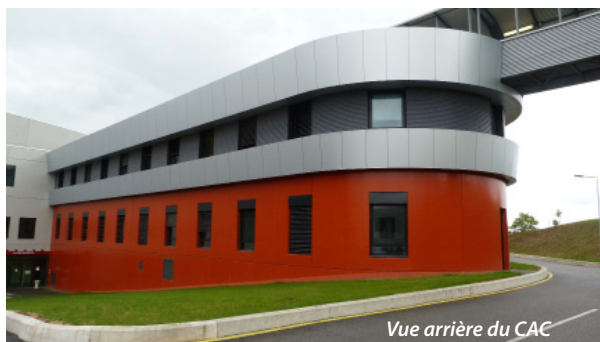
Vue arrière du CAC